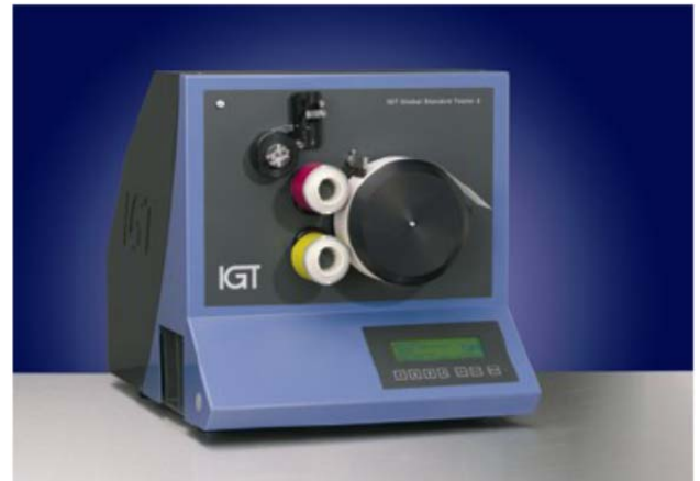
Global Standard Testers