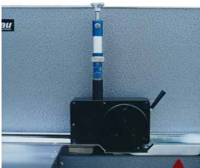
Illustration: prüfbau Offset Attachment, wetting chamber, automated version available オフセットアタッチメント (湿し水装置)

モイスチャーフィルム寸法: 20 x 200 mm 30 x 200 mm または、カスタム仕様 印刷スピード: 1 m/sec、4 m/sec 0.5, 1, 2, 3, 4, 5, 6 m/sec, またはカスタム仕様 印刷インターバル: 0.1 秒幅で調整可能 0.1 秒 - 60 分 寸法: 640 x 452 x 600 mm 重量: 約 125 kg 電源: 全てに対応 外装: ワニス処理, ハンマー処理