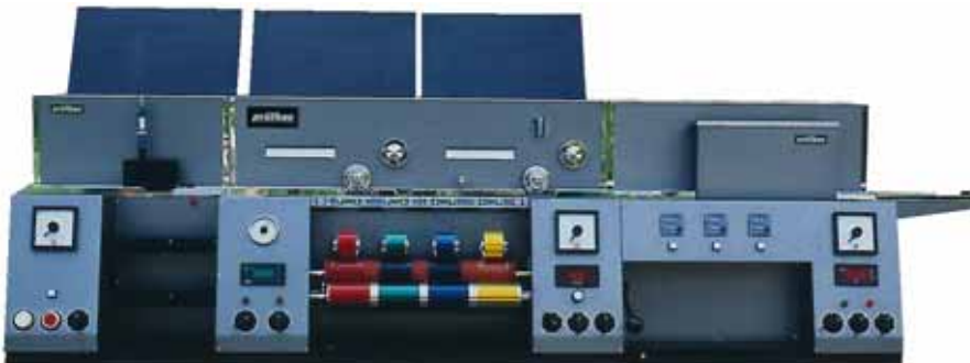
Illustration: The prüfbau module system

オフセットアタッチメントの組み合わせは、例えばドライヤーと統合してラテックスのテストに使用することが出来ます。