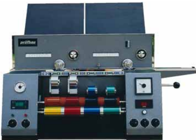
Illustration: prüfbau Multipurpose Printability Testing Machine